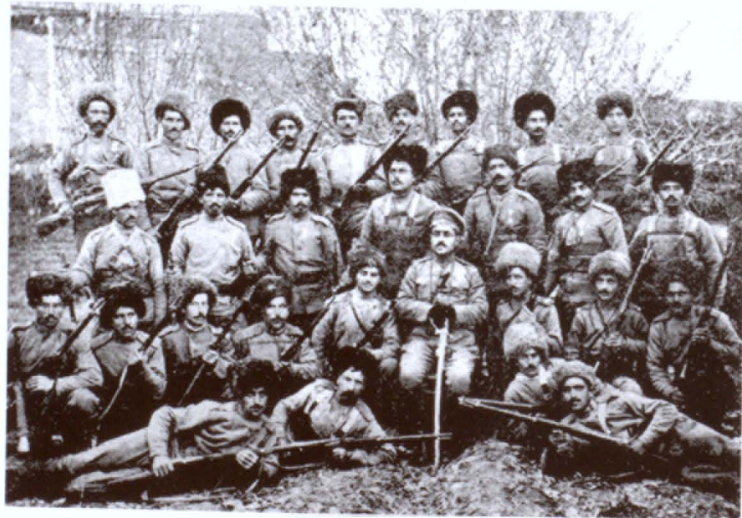
Գարեգին Նժդեհի կամաւորական ջոկատը, 1915 թ.