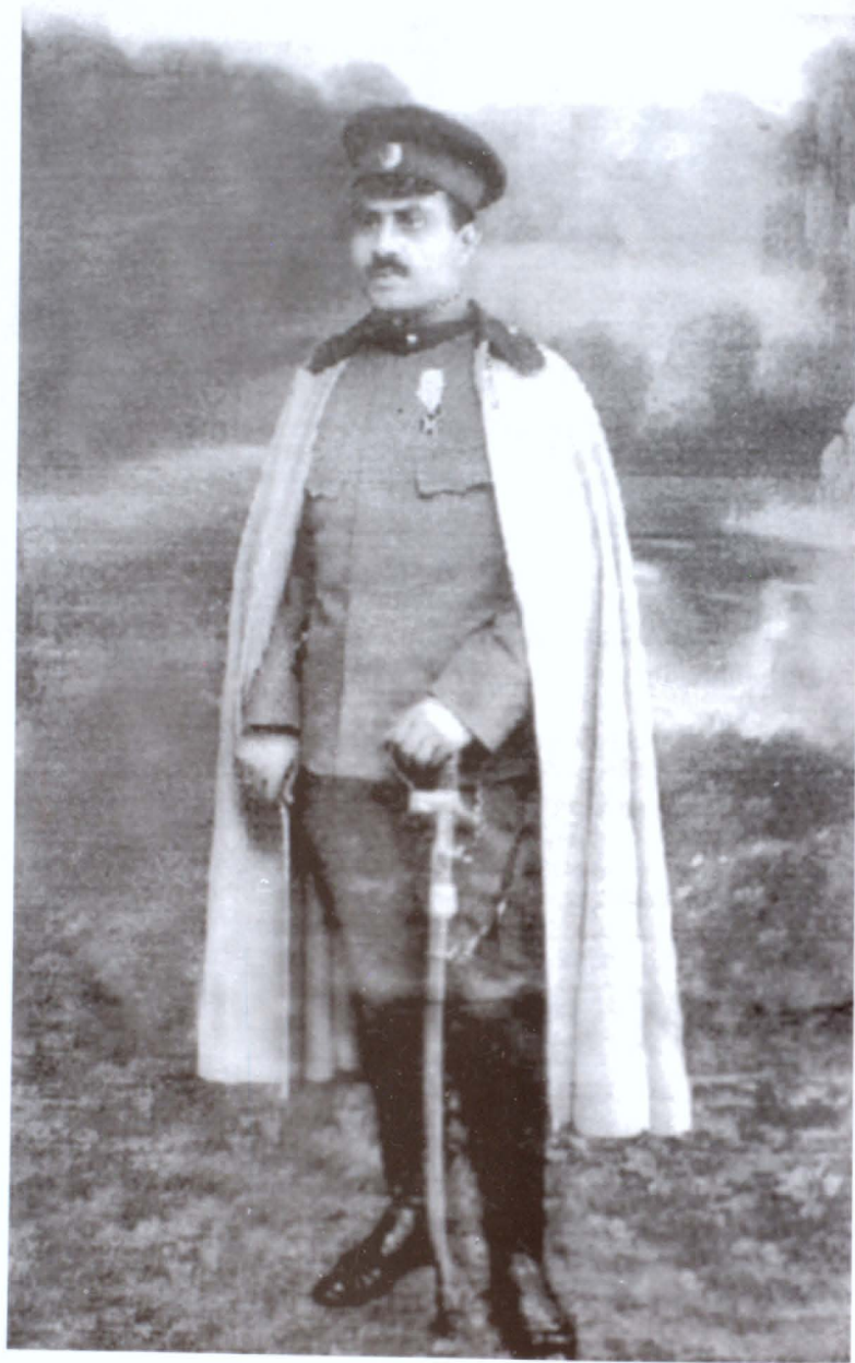
Նժդիհ, 1919 թ.