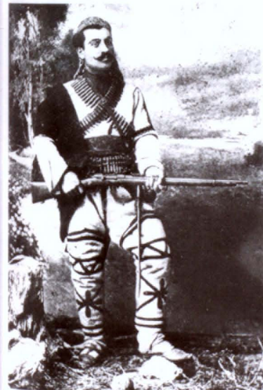
Նժդեհը մակեդոնական հայրուկի զգեստով, 1906 թ.