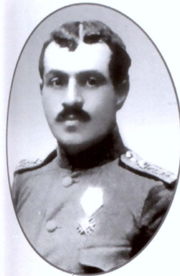
Գարեգին Նժդեհը բուլղարական սպայի համազգեստով