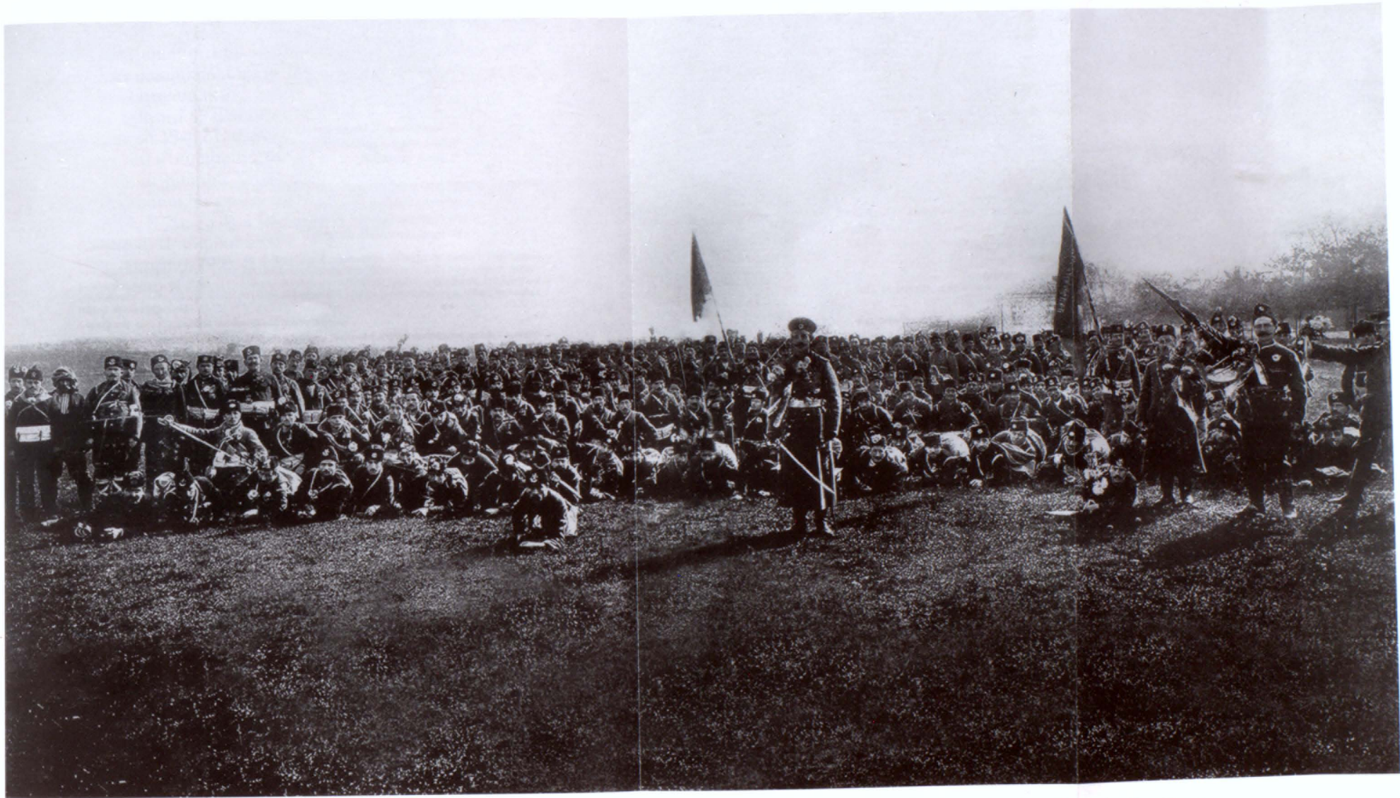
Հայկական գունդը Բալկանեան պատերազմի սկզբին, 1912 թ. հոկտեմբերի վերջ, առջեւում Նժդեհն ու Անդրանիկը