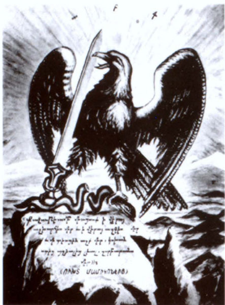
Յեղակոսների զինանշանը, 1933թ.